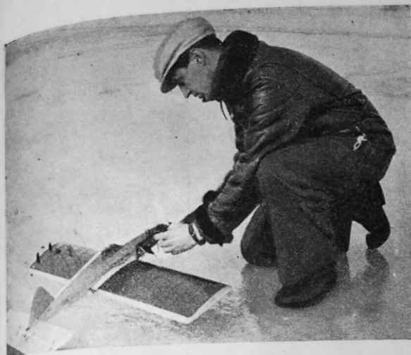
Lentonäytöksissä on ollut mukana myös siimallaohjattujen lennokkien esityksiä, jotka ovat olleet hyvin suosittuja varsinkin nuoremman polven keskuudessa. Kuvassa Lumes käynnistää moottoria Kiuruveden näytöksessä.