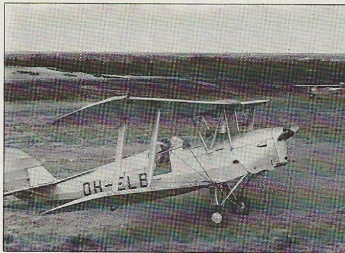
Tiger Moth oli mukana näyttösten yleisölennätyksissä. Oikealla startissa Jämiltä samoissa tehtävissä käytetty Piper Cub.