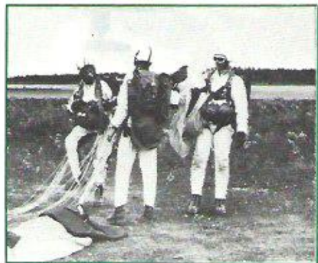
Ruotsin voittoisa joukkue viimeisen onnistuneen joukkuetarkkuushypyn jälkeen. ↑