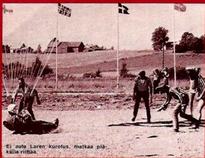
Ei autu Laren kurotus, matkaa plä-källä riittää.