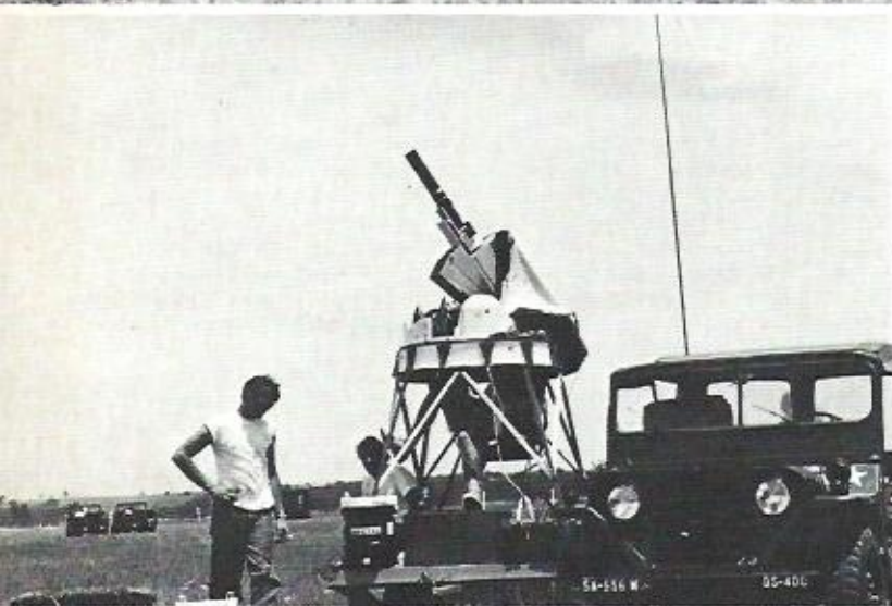
▲ Välineistö oli kovaa luokkaa, kuvassa instrumentti tyylilyhyppien seuraamista varten.