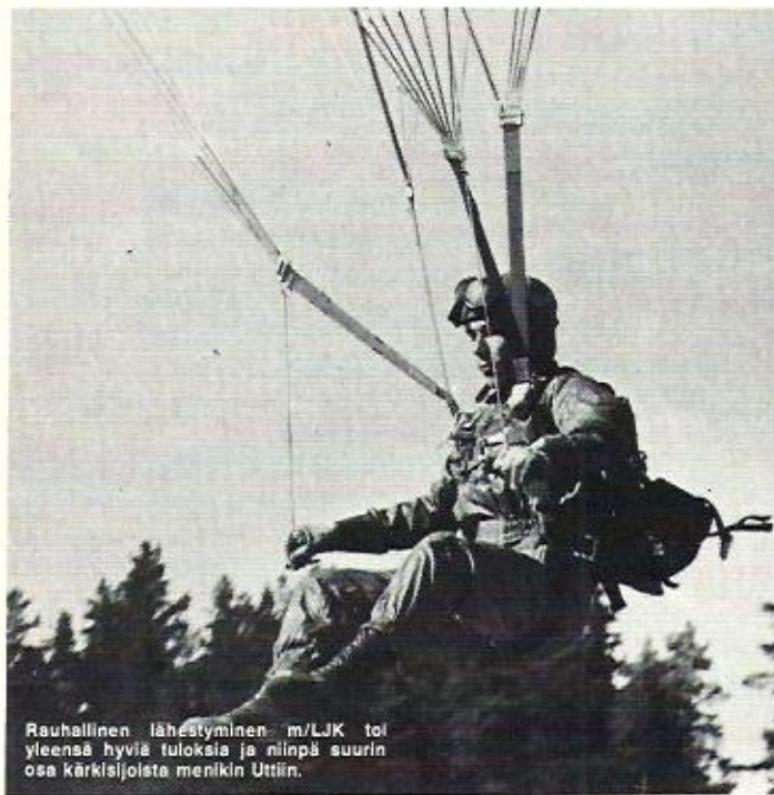
Rauhallinen lähestyminen m/LJK toi yleensä hyviä tuloksia ja niinpä suurin osa kärkisijoista menikin Uttiin.

Kaikki muu onkin sitten kohdallaan. Pari saunaa, uima-allas (joka tosin nyt pyttyi hetken), ja hyvät peseytymismahdollisuudet aivan leirialueen äärellä ovat seikkoja, joita ei voi arvostaa liikaa. Edellä mainitut kuivun ja lämpimän telttailumaaston lisäksi tekevät Nummelasta ehkä parhaan ilmailuhenkisen oleskelupaikan – jos ei tarvitsisi hypätä kilpaa laskuvarjolla. Niinpä Utti ja Immola jäävät lähes ainoiksi suurten laskuvarjokilpailujen paikoiksi. Sielläpäin kai taas ensi vuonna tava-