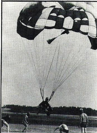
Olipa unohtua OLK:n onnenheinä suussaan hyppävältä Raimo Kemppaiselta, kuin myös monelta muulta, vapaana olevan jalan hallinta kuroituksen aikana. Tässä kohdassa mitaus kuitenkin suoritettiin siitä jalasta, mistä pitikin.