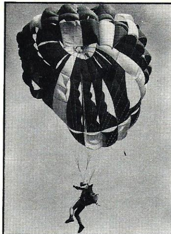
Pallokuvat olivat "jautaa" vielä näissä kisoissa. Sotilaallista tyyliä Papillonilla esittää LjK:n Hannu Laitinen.