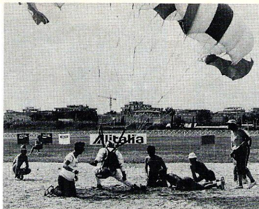
Tulos: 0.00. Voimassa olevaa henkilökohtaisen tarkkuuden maailmanennätystä hallussaan pitävä USA:n Chuck Collingwood neuvostoliittolaisen sähköpläkän kimpussa.

Kotomaisissa SM-kilpailuissamme "samppiooniksi" yltänyt Make Jääskeläinen epäonnistui jossain määrin avaushypyllään, saaden tuloksekseen 9.47 sekuntia. Ensimmäisen kierroksen jälkeen sijoitus oli kuudenkymmenen huonommalla puolella.