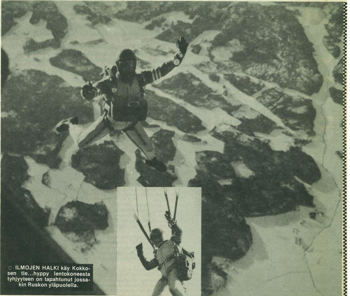
● ILMOJEN HALKI käy Kokkonen tie...hyppy lentokoneesta tyhjiyteen on tapahtunut jossakin Ruskon yläpuolella.

Tämä kausi meni Sepolla jälen loistavasti. SM-kilpailukokon alle 350-cc:n luokassa hän joiittui toiseksi ja 351-750-kuuoisissa kolmanneksi. Lisäksi kokkonen ajoi Suomen maa-