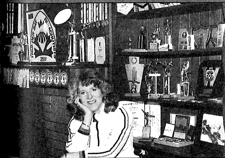
Kathyn kodin kellarikerrokses- sa olevaan tak- kahuoneeseen ei