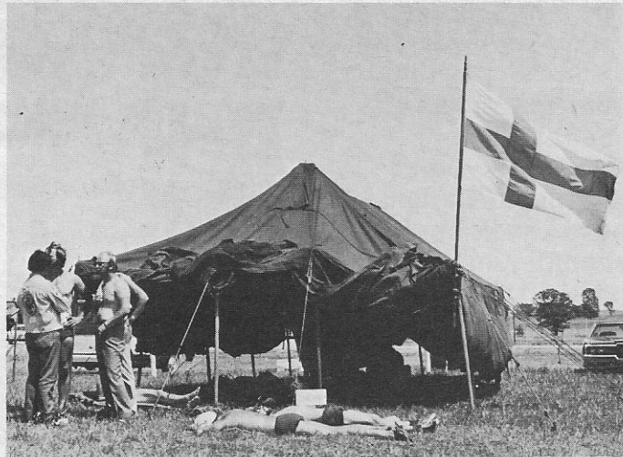
▲ Siestaa helteisenä iltapäivänä. Teltoistakin oli helteen vuoksi pakko modifioida vähän entistä ilmapampia.

Naisten lajeissa Neuvostoliitto korjasti eniten kultaisia 'lät-