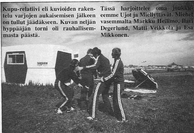
Kupu-relatiivi eli kuvioiden rakentelu varjojen aukaisemisen jälkeen on tullut jäädäkseen. Kuvan neljän hyppääjän torni oli rauhallisemmasta päästä.

Suomalaiset aloittivat hyvin hypäten ensimmäisellään 5 pistettä ja jatkaen kisojen loppuun asti 3 pisteen keskimääräisellä tuloksella. Kokonaispistemääräksi joukkueemme sai 33 pistettä ja 14. sijan. Pohjoismaista parhaiten sijoit-