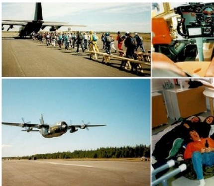
Kuva 1: Kuvastoa Hercules-boogiestä. Alla ryhmäkuvassa mukana olleet vaasalaiset (Pauli Arpikari/SLK), Minna ja Merita.