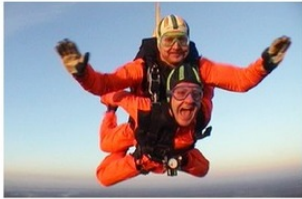
Kuva 18: Tandem-hyppääminen toi kerhon toimintaa lisää. Tandem-oppiilat olivat kokemuksesta innoissaan, kuten kuvasta näky.

Tandem-hyppääminen alkoi Kirjoittanut Pauli Mäki-Lohiluoma