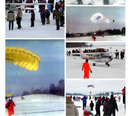
Talvi-ilmailupäivä Rätälinsaaressa edustalla sai paljon huomiota